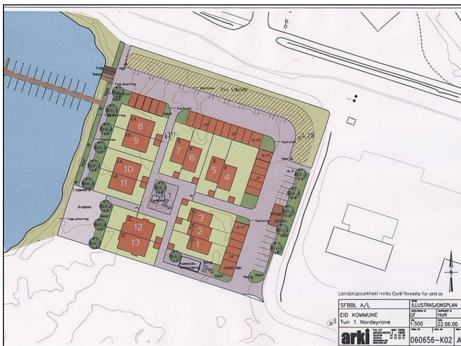
Illustrasjonsplan for bustadområdet.

Nordøyrane er lokalisert like nord for Eid sentrum og danner eit nes ut i fjorden. Her er det planlagt til saman tre tun med tett låg bustadutbygging. Denne utbyggingsplanen gjeld Tun 1 - øvre del av området som er regulert til bustadformål. Planområdet ligg sentralt like vest for Eid sentrum, ved sjøkanten. Det er planlagt 13 bueiningar omkring eit bilfritt tun, med carportplassar og parkering i ytterkantane av tunet. Pga. dei tøffe vindtilhøva har ein lagt vekt på å lage lune uterom, samtidig som ein sikrar utsikt mot sjøen. Dette blir det første steget av to byggetrinn for bustader i området.